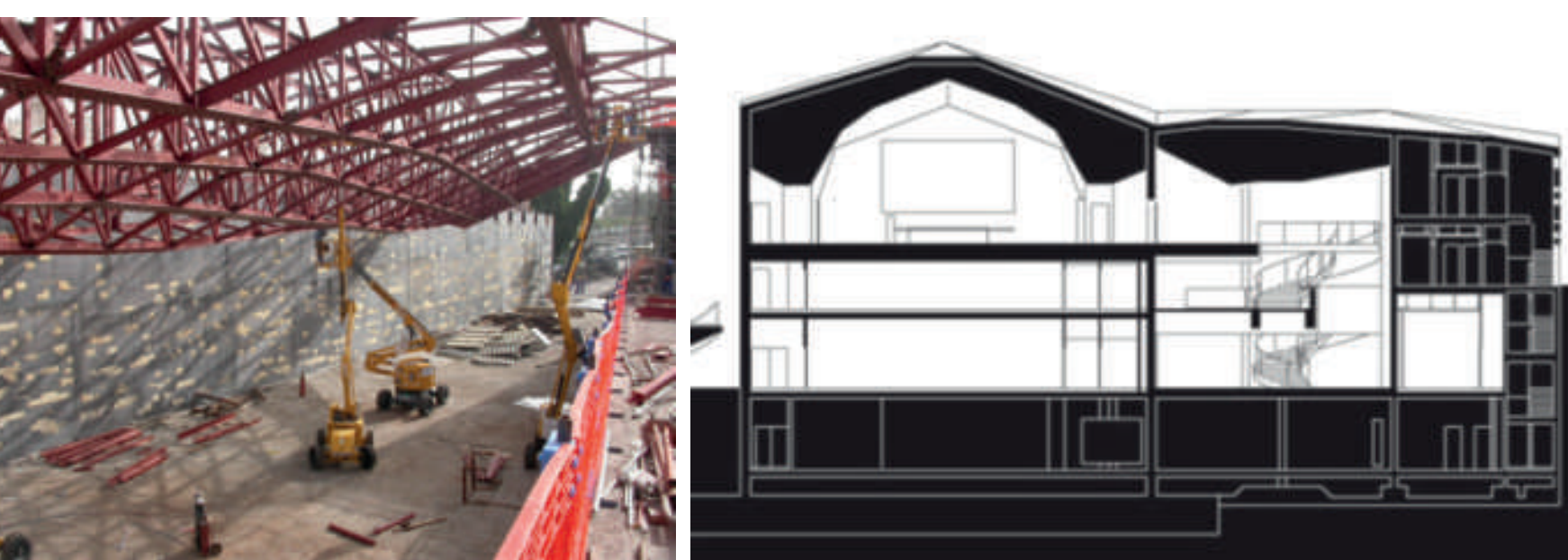
Referente 1 Tenerife Espacio para las Artes Santa Cruz de Tenerife, España Herzog & de Meuron

La estructura se acopla a la composición espacial